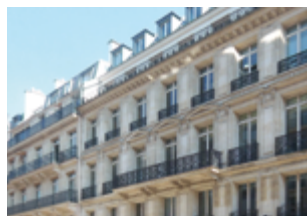
R. de Marignan/R. Marbeuf - Paris 8 ème 12 042 m 2 (bureaux) Expertisé pour Invesco (IREEF)