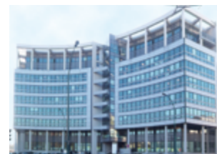
Avenue Carnot - Massy 35 038 m 2 (bureaux) Expertisé pour UBS