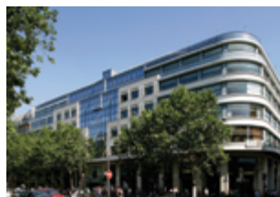
Les 3 Quartiers - Paris 1 er 29 618 m 2 (commerces/bureaux) Expertisé pour MGPA