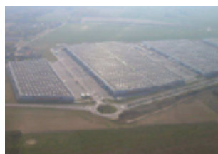
ZAC des Brateaux - Villabé 202 294 m 2 (entrepôts) Expertisé pour TIAA