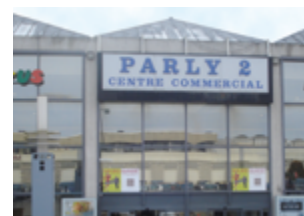
Centre Commercial Parly 2 - Le Chesnay 34 208 m 2 (commerces) Expertisé pour ADIA