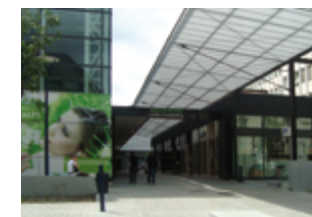
22000 Saint-Brieuc 11 620 m 2 Commerces