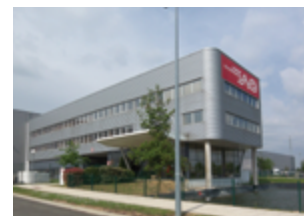
Avenue Anna Lindh - Vert-Saint-Denis 93 396 m 2 (entrepôts) Expertisé pour Eurohypo