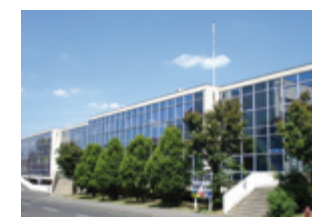
Portefeuille de 16 immeubles - France 139 205 m 2 (activités/bureaux)