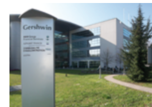
78280 Guyancourt 20 950 m 2 Bureaux