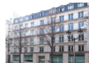
92300 Levallois-Perret 36 390 m 2 Bureaux