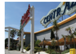
Centre Commercial Centr'Azur - Hyères 6 235 m 2 (commerces) Expertisé pour Eurocommercial