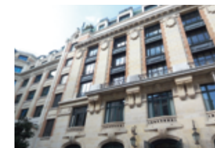
75008 Paris 19 863 m 2 Bureaux