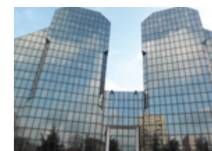
Ile-de-France 82 694 m 2 6 immeubles de bureaux