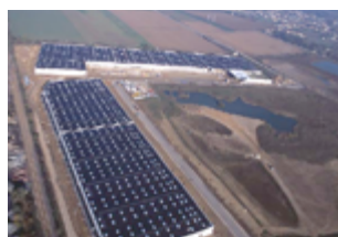
Bruyères-sur-Oise 114 500 m 2 (logistique) Expertisé pour TIAA-CREF