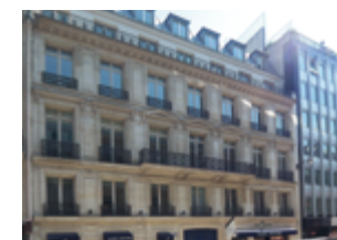
75008 Paris 12 042 m 2 Bureaux et commerces