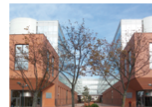
Le Delage - Gennevilliers 45 535 m 2 (bureaux) Expertisé pour ADIA