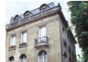
Rue des Gravieres - Neuilly-sur-Seine 450 m 2 (hôtel particulier - résidentiel) Expertisé pour American Embassy