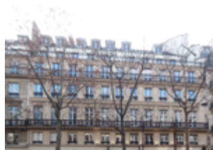
Bld de la Madeleine - Paris 1 er 12 482 m 2 (bureaux/commerces) Expertisé pour ADIA