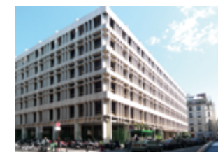
75002 Paris 6 681 m 2 Bureaux