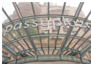
C. C. Passy Plaza - Paris 16 ème 8 083 m 2 (commerces) Expertisé pour Eurocommercial