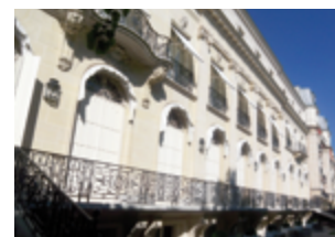
Avenue Emile Deschanel - Paris 7 ème 2 887 m 2 (hôtel particulier - résidentiel) Expertisé pour Markshaff Services Ltd