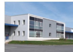
Portefeuille de 14 immeubles - Ile-de-France 70 797 m 2 (bureaux, logistique et d'activité) Expertisé pour Mansford Real Estate