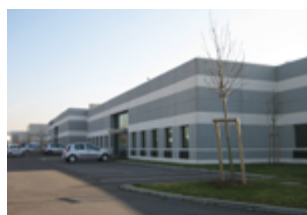
Portefeuille de 5 immeubles - France 48 643 m 2 (activités) Expertisé pour LIM